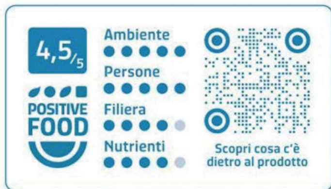
Etichetta “Positive Food”

«Positive Food» 189 , che prende in considerazione quattro indici: «ambiente», «persone» (con riferimento alle loro condizioni lavorative 190 ), «filiera» 191 e «nutrienti» (come il contenuto di calcio, il rapporto proteine/grassi e la presenza di sale, posto che il progetto, ancora in fase sperimentale, si incentra attualmente sui prodotti lattiero-caseari 192 ). Così queste tipologie di etichettature, in assenza di una adeguata ed omogenea disciplina possono essere addirittura controproducenti: in questo caso specifico, in effetti si vengono a ‘mescolare’ indicatori ambientali o sul cambiamento climatico, insieme a quelli nutrizionali correndo il rischio di realizzare un’inappropriata commissione tra questa tipologia di etichettatura e quella tipicamente nutrizionale come quella che è al vaglio attualmente delle istituzioni dell’Unione europea ai sensi dell’art. 35 del regolamento 1169/2011.