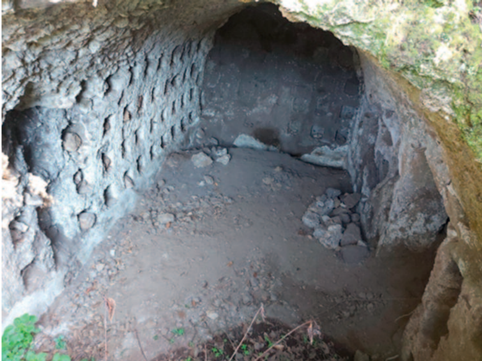
Fig. 10. Il colombaio; particolare dell'interno.

cavità rupestre di maggiori dimensioni, con planimetria rettilinea e copertura a volta a botte. La struttura comprende una galleria principale con vani laterali, orientata Ovest-Est, da cui si accede, sul lato sinistro, a una galleria gemella. Per caratteristiche tipologiche e costruttive, questa cavità presenta forti analogie con strutture simili ampiamente documentate nella Tuscia, presso il vicino complesso rupestre di Fosso Formicola 47 , a Nord di Roma. Il terrazzamento su cui sorgono queste