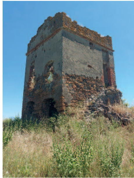
Fig. 4. La torre della Bandita o “Piccionara”.

tata in un disegno del 1547 attribuito a Eufrosino Della Volpaia, dove appare coronata da merli guelfi e identificata con il nome di “Bandita” (o Piccionara ) (fig. 3, n. 2), posta a presidio del percorso viario sottostante. La torre sorge su un pianoro tufaceo nei pressi della valle di San Sebastiano e Monte del Nibbio e si intravede a malapena dalla strada. Essa, si trova a Sud del Castrum di Galeria da cui dista 1 km 26 . L’edificio (fig. 4), a pianta quadrata di circa 5 m per lato (25 m 2 totali), è realizzato in bozze e conci di tufo squadrati legati con malta. Benché l’aspetto attuale derivi da trasformazioni successive, non si può escludere che la torre sia di origine più antica, molto probabilmente anteriore al XV secolo, come suggeriscono le tecniche murarie e il contesto archeologico in cui si inserisce. In origine la torre si sviluppava su tre livelli, come rivelano le tracce superstiti dei solai interni oggi scomparsi. Al pianterreno si aprono due ingressi: uno a ovest, affiancato da una finestra, e uno a est, che conduce a un ambiente un tempo coperto da una volta a padiglione, ora parzialmente crollata. Da qui si accede a un piccolo sottoscala, forse destinato a forno, illuminato da una finestrella. Un terzo ingresso, situato a sud-est, conduceva direttamente al secondo piano tramite una scala