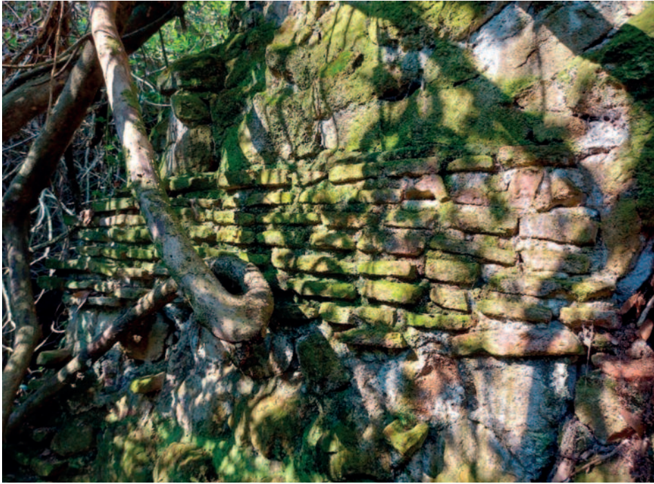
Fig. 9. La Mola di Brandosa. Particolare della parete Sud.

calcare antichi tracciati e tagliate nella roccia, si distribuiscono, a quote differenti, cinque ambienti rupestri (fig. 3, n. 10). La prima struttura è costituita da una galleria con copertura a volta a botte; sulla parete sinistra sono visibili sette fori allineati, verosimilmente destinati a sostenere una mensola lignea. La seconda cavità è accessibile attraverso una tagliata, lungo la quale si apre una piccola nicchia, forse interpretabile come antica edicola votiva. Proseguendo lungo il percorso si raggiunge un colombaio (fig. 10), tra gli ambienti più rilevanti del complesso. Di pianta rettangolare e orientato Est-Ovest, pre-