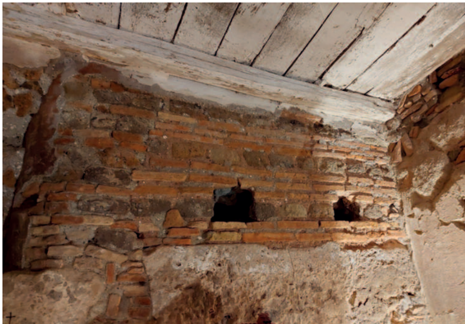
Fig. 6. Sotterranei della Chiesa di Santa Maria di Galeria in Celsano. Probabile base della torre campanaria, parete in opera vittata di V-VI secolo d.C..

tura in opera vittata ancora leggibile alla base dell'attuale torre campanaria (fig. 6), vi è una epigrafe funeraria relativa a un presbyter , datata al 529, rinvenuta sul finire del Settecento “ in hortulo ecclesiae S. Mariae de Galeria ” 30 . Ad ogni modo, nonostante vi sia un vuoto cronologico tra il VI e l’XI secolo, alla luce degli elementi emersi nel corso di questo lavoro, è ipotizzabile che l’edificio paleocristiano abbia assunto, entro la metà dell’VIII secolo, la funzione di centro direzionale della domusculta Galeria Au-