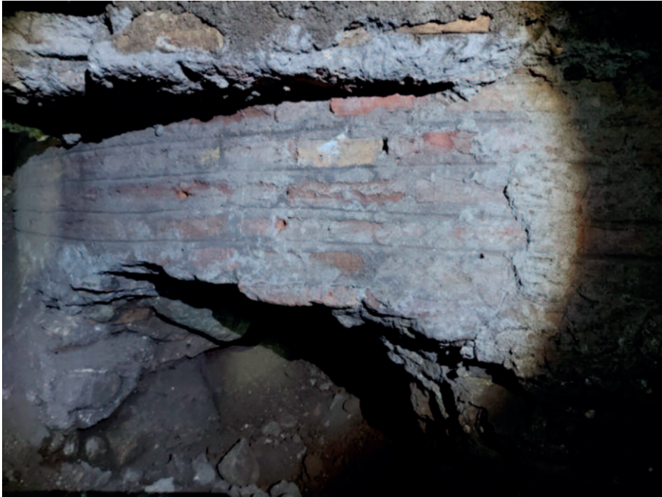
Fig. 7. Particolare dell'abside centrale presso la Chiesa di Santa Maria di Galeria in Celsano.

cio situato di fronte alla piazzetta antistante la chiesa, che con ogni probabilità, mettendolo a confronto con gli scavi della fase II a Capracorum , ospitava gli ambienti di servizio 38 . Tuttavia, oltre alle analogie con la fase II di Santa Cornelia, si riscontrano somiglianze anche con la fase evolutiva successiva della stessa chiesa, corrispondente alla fase III (metà XI secolo). Le analogie planimetriche tra Santa Maria di Galeria e questa fase di Santa Cornelia suggeriscono una continuità nell'evoluzione