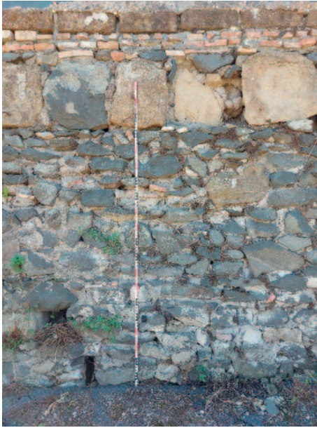
Fig. 8. Particolare dei blocchi di tufo reimpiegati nel muro di cinta presso la Chiesa di Santa Maria di Galeria in Celsano.

colo, per dimensioni e lavorazione analoghi a quelle riscontrabili nell'opera quadrata della chiesa di Santa Cornelia ( domusculta Capracorum ) e nelle mura Aureliane (presso porta Ostiense e in altri tratti) 39 ; benché limitati e preliminari, questi dati possono essere letti come indizi di una possibile fase altomedievale riferibile al sito di Santa Maria di Galeria, un'ipotesi che potrà essere verificata attraverso futuri survey più approfondite.