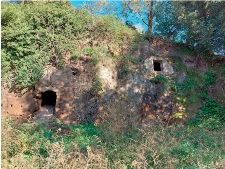
Fig. 11. Particolare del sito rupestre di Brandosa. La rampa e il probabile secondo colombaio.

tura o una transenna. L'ultima struttura del complesso, e al contempo la più articolata e monumentale, si colloca sullo stesso versante della valle. Si tratta di un'architettura ipogea parzialmente crollata, caratterizzata da una planimetria mistilinea, con l'alternanza di segmenti curvilinei e rettilinei. Gli ambienti si distribuiscono su più livelli, adattandosi alla morfologia irregolare del banco tufaceo. La complessità architettonica e la conformazione degli spazi suggeriscono una fase costruttiva antica e una lunga continuità d'uso. Alla luce delle osservazioni condotte, risulta