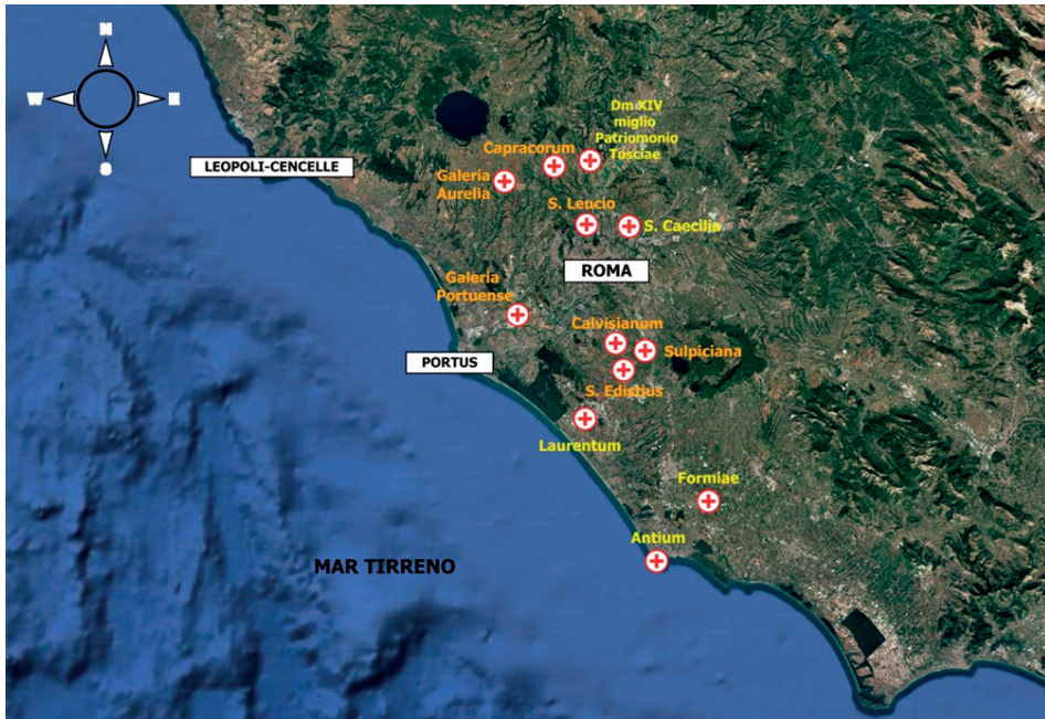
Fig. 1. Le domuscultae pontificie fondate da papa Zaccaria in giallo e papa Adriano I in arancio (elaborazione grafica di A. Bucci).

dell'odierna Campania rappresentavano l'unica fonte di approvvigionamento extraterritoriale rimaste a Roma. Tuttavia, le sole merci campane non sarebbero bastate al sostegno della popolazione romana e nella seconda metà dell'VIII secolo, per sopperire alla mancanza dei viveri, in particolare del grano, i pontefici decisero di riorganizzare e razionalizzare le proprietà ecclesiastiche della campagna romana. Spetterà dunque a due pontefici, papa Zaccaria (741-752) e poi a papa Adriano I (772-795), l'istituzione di dodici grandi aziende agricole a gestione diretta della chiesa, sorte su terreni di proprietà pontificia conosciute dal Liber Pontifica-