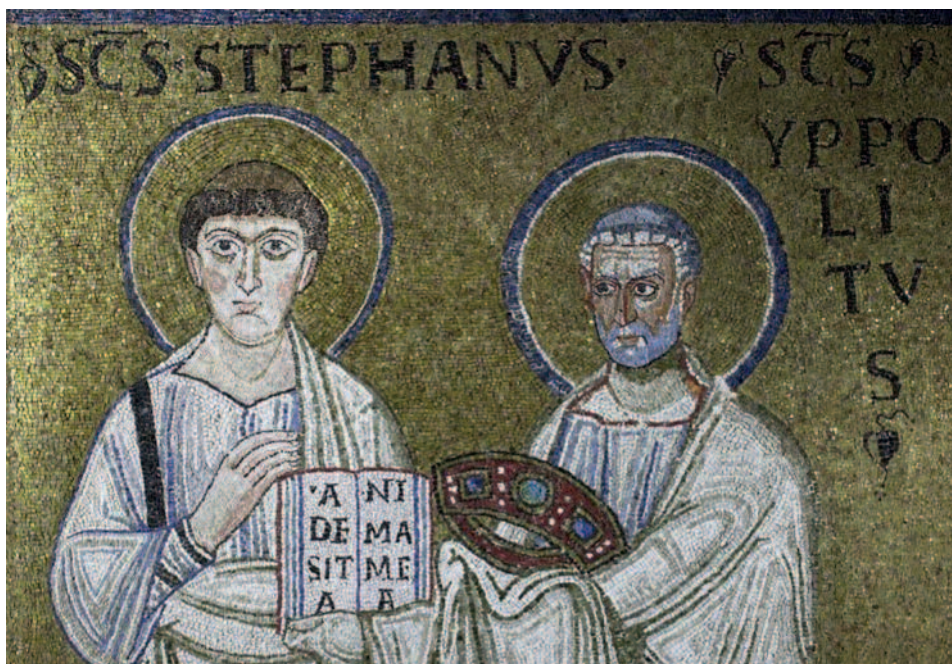
Fig. 8. Mosaico dell'arco di San Lorenzo fuori le mura, sezione restaurata (particolare).

prime due raffigurazioni, risulta altrettanto degna di nota la restituzione prospettica del cerchio che accomuna la miniatura ottoniana al modo impiegato per rappresentare, nel mosaico di nostro interesse, la corona del martirio del santo. Questa, trova a sua volta alcuni confronti – seppur con qualche variante – già nel IX secolo nell'arco trionfale della basilica di Santa Prassede 72 , per poi diffondersi maggior-