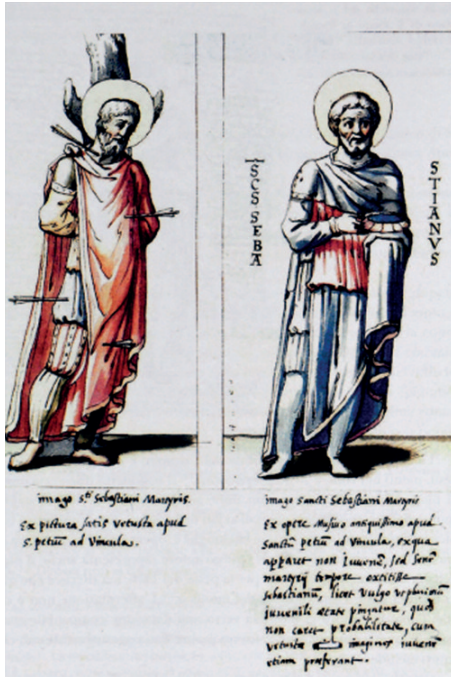
Fig. 2. CITTÀ DEL VATICANO, BAV, Vat. Lat. 5508, f. 24r (foto da CASTROVINCI 2009).

morare i cento anni dalla fine della pestilenza del 1467 20 , si rivela dunque la prima e l'ultima collocazione nota dell'opera prima che questa venisse staccata a massello e posizionata nella collocazione odierna per ordine di papa Innocenzo XI (1676-1689) 21 .