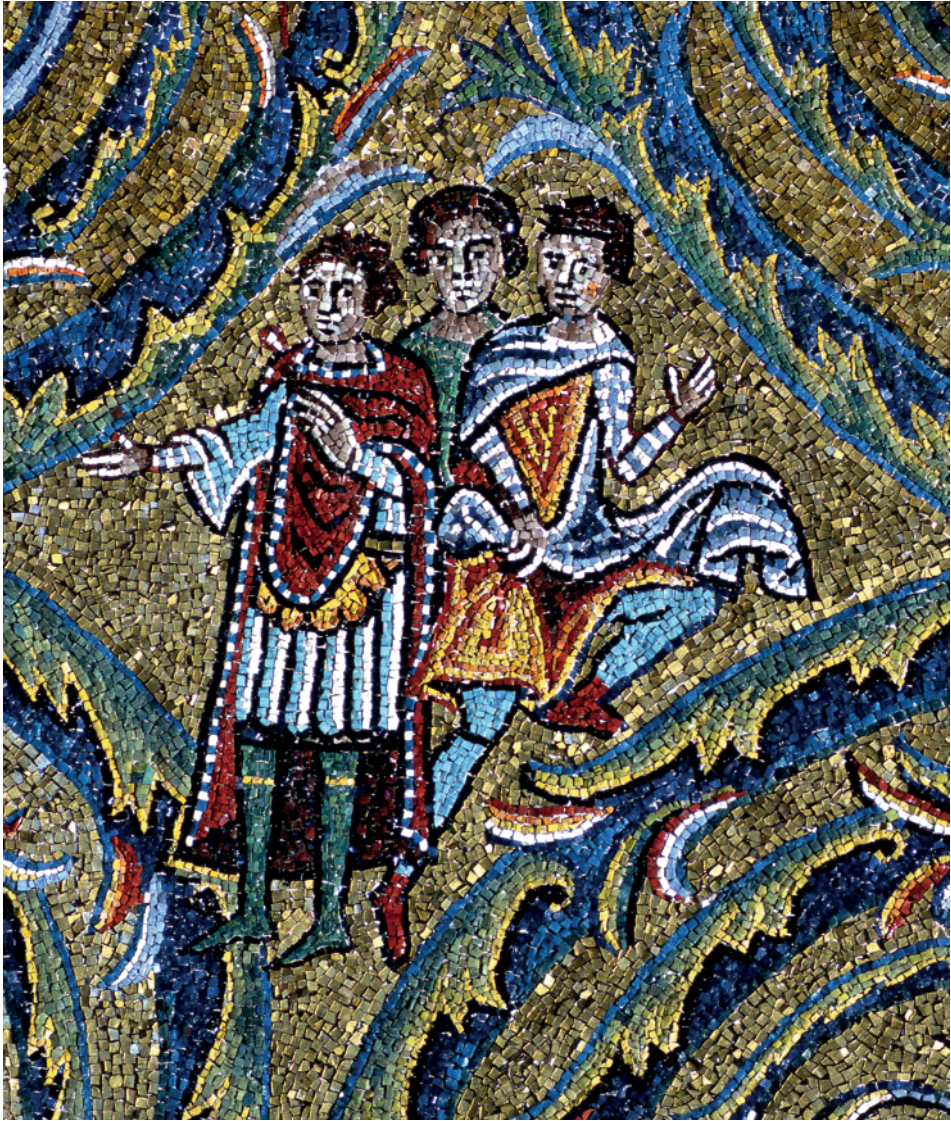
Fig. 5. Mosaico dell'abside di San Clemente (particolare).

inoltre ad un decorativismo – attuato per mezzo di accostamenti cromatici – molto lontano dai precisi disegni ricamati sulle vesti dei soldati delle opere di VII secolo. Maggior somiglianza,