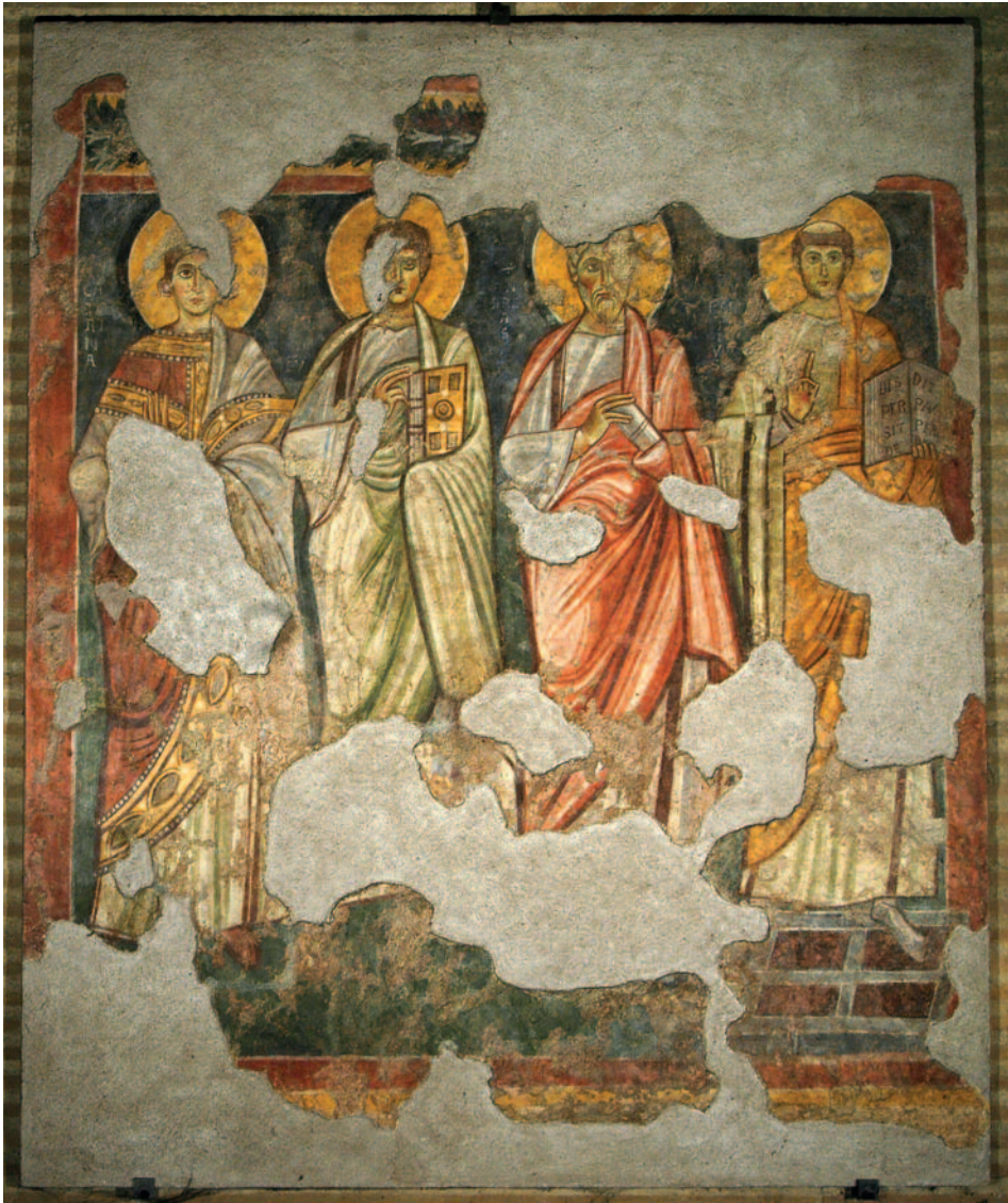
Fig. 9. Affresco con santi stanti, cappella H9, San Lorenzo fuori le Mura.

basilica di Sant'Anastasio a Castel Sant'Elia 73 .