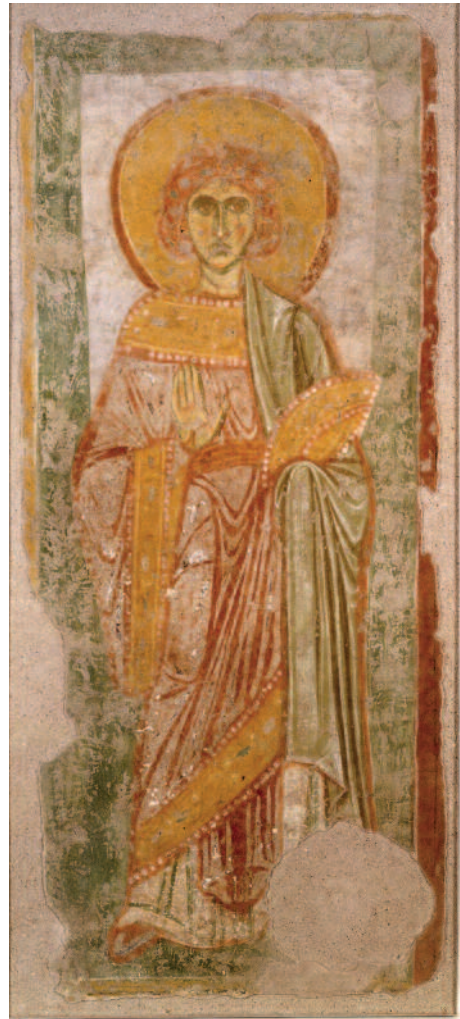
Fig. 6. Affresco di Santa Principessa , Sant'Agnese fuori le mura (foto da BORDI 2006b).

Ancora, interessante appare il trattamento della manica nel san Sebastiano , che si distingue per alcuni caratteri quali la foggia e la volumetria accentuata. Componenti riscontrabili, in primo luogo, in una delle Province che porgono i