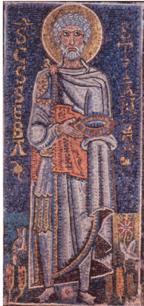
Fig. 1. Pannello musivo di san Sebastiano.

tuttavia riscontro in nessuna delle precedenti rappresentazioni del martire, né tantomeno nella sua raffigurazione, un tempo inserita nella teoria di santi della chiesa inferiore di San Saba sul Piccolo Aventino 9 , datata al pontificato di