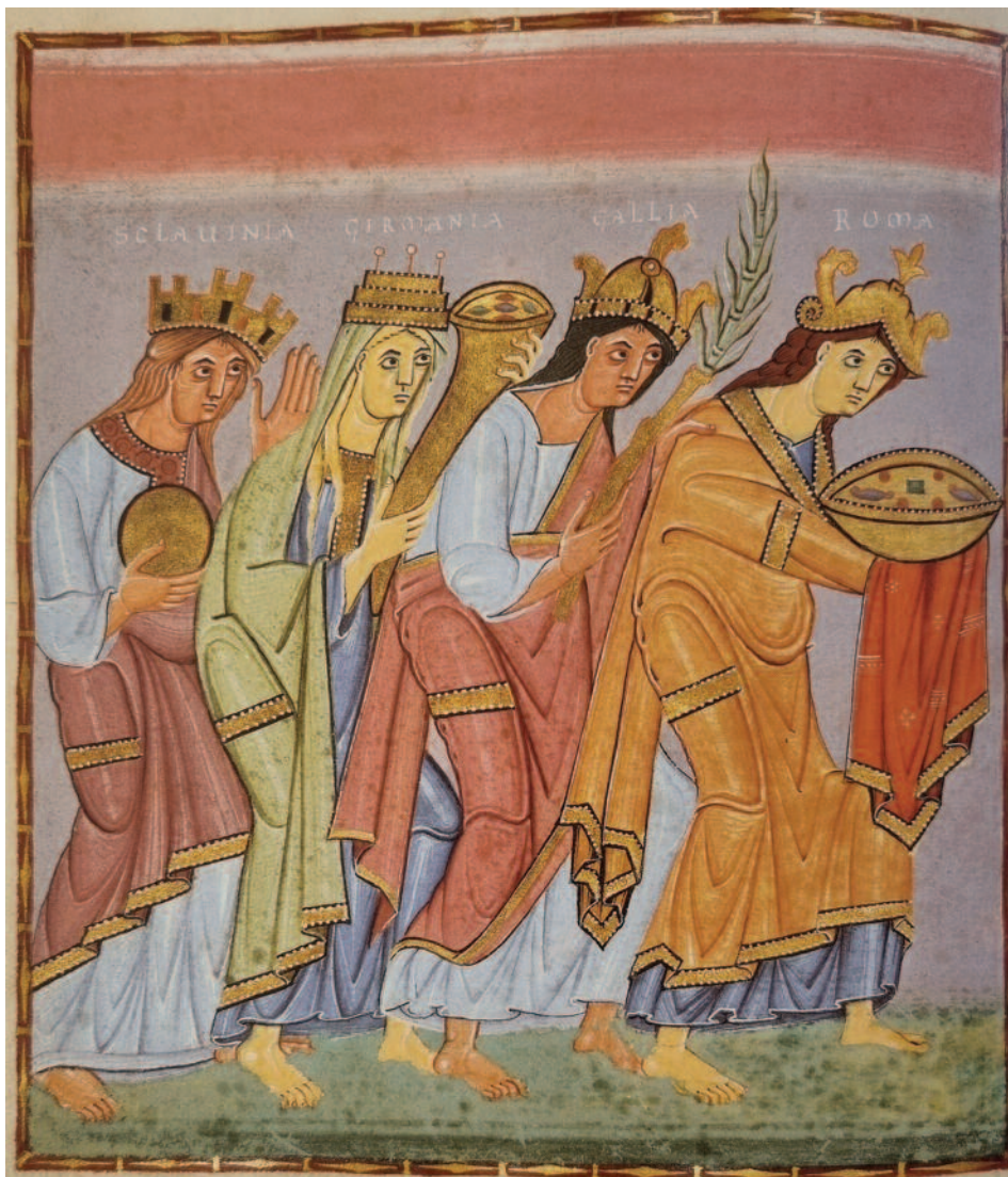
Fig. 7. MÜNCHEN, Bayerische Staatsbibliothek, lat. 4453, f. 23v.

mente, in opere dell'XI secolo come le figure dipinte nell'abside di una nicchia della catacomba di Sant'Ermite 71 . An-