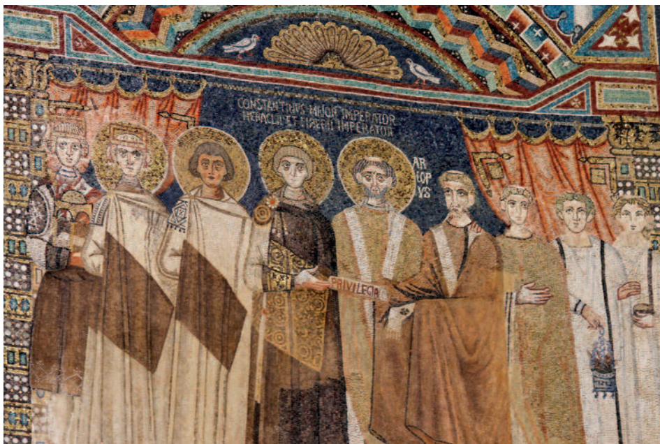
Fig. 3. Ravenna, S. Apollinare in Classe, abside, pannello a mosaico, l'imperatore Costantino IV consegna i privilegi a Reparato per confermare l'autonomia della chiesa di Ravenna, part.

papa Dono. Nemmeno Agnello è in grado di fornire una spiegazione all'accaduto 54 .