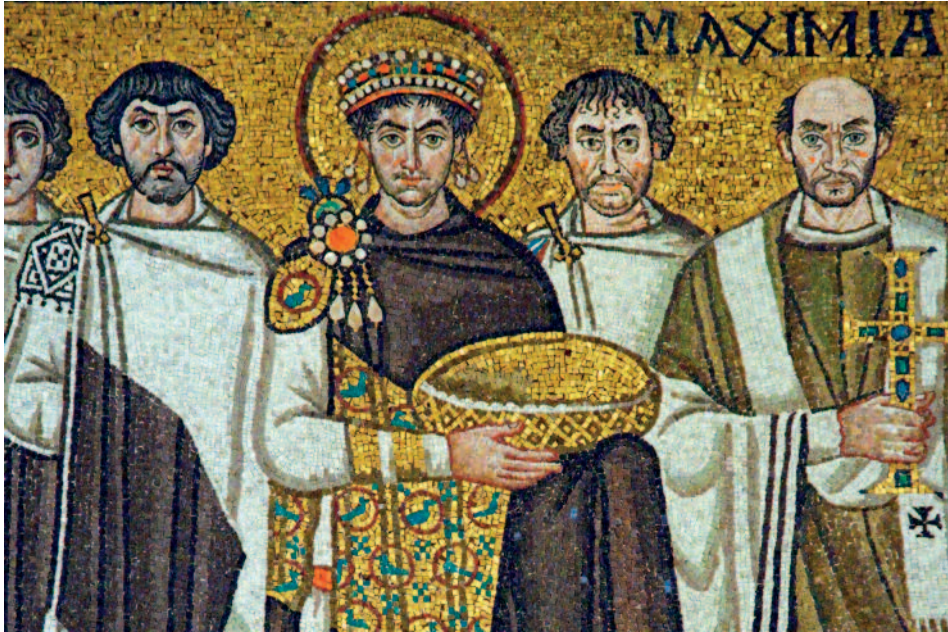
Fig. 2. Ravenna, S. Vitale, parete nord del presbitero, pannello a mosaico, Giustiniano con la sua corte offre doni all'arcivescovo Massimiano, part. (foto di Volodymyr Vlasenko, via Wikimedia Commons, CC BY-SA 4.0).

questo momento, infatti, saranno principalmente i vescovi ad occuparsi alla costruzione e decorazione di edifici e alla donazione di preziosi oggetti liturgici.