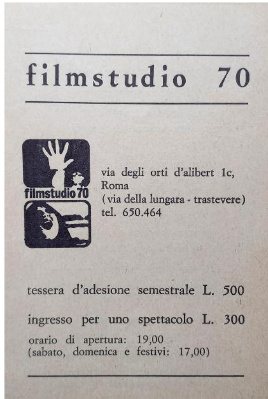
Fig. 3 – Tessera associativa del Filmstudio, inizio anni 70.

Lizzani (solo per citare i più importanti) – e la scrittura sia critico-saggistica sia per il cinema, con le sceneggiature di film di Gianni Amico, Dario Argento, Giuseppe e Bernardo Bertolucci (con quest'ultimo scrive L'ultimo imperatore , uscito nel 1987, ma viene a mancare nel 1985 prima dell'inizio delle riprese). Aprà e Ungari, pur nella differenza caratteriale, sono uniti non solo da profonda stima e amicizia ma dall'approccio lucido e passionale al lavoro critico e organizzativo, e la loro collaborazione non si ferma al Filmstudio 70 ma prosegue in ambito festivaliero negli anni successivi 8 .