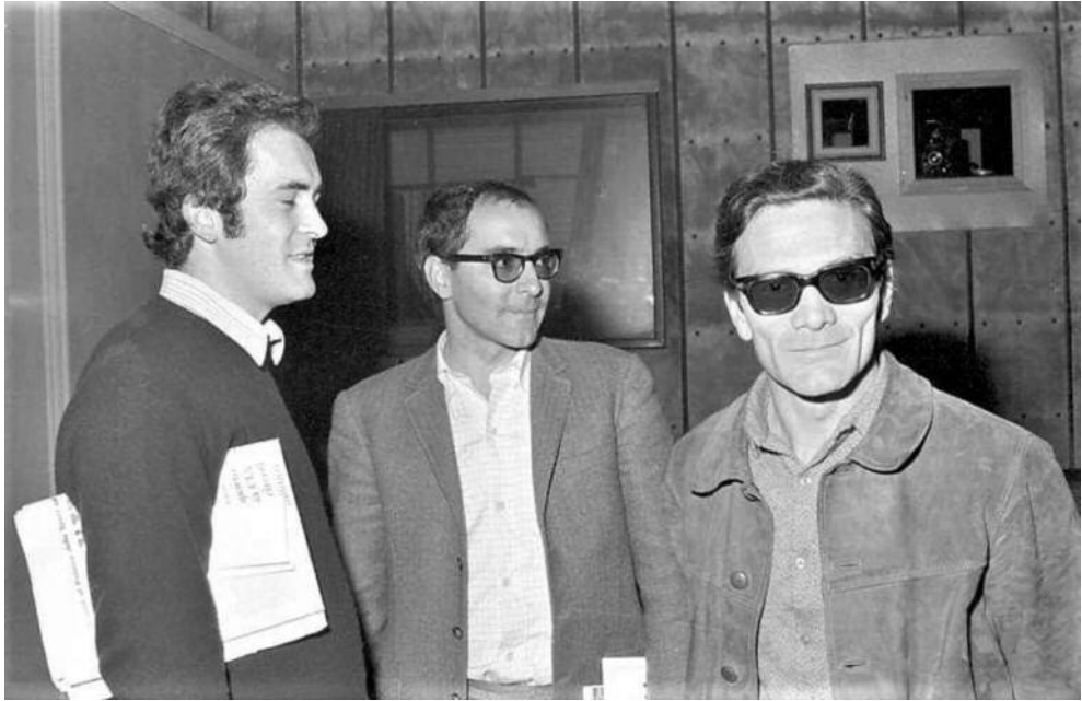
Fig. 1 – B. Bertolucci, J.-L. Godard e P. P. Pasolini al Filmstudio 1970.

leggere queste informazioni come segno di un passaggio di consegne morbido tra i due gruppi, un avvicinamento progressivo alla gestione del filmclub da parte dei due critici. Ancora prima, nel programma dal 4 febbraio al 31 marzo, al Filmstudio 70 si svolge la I rassegna di «Cinema&Film» (24 febbraio-5 marzo) che così viene presentata: