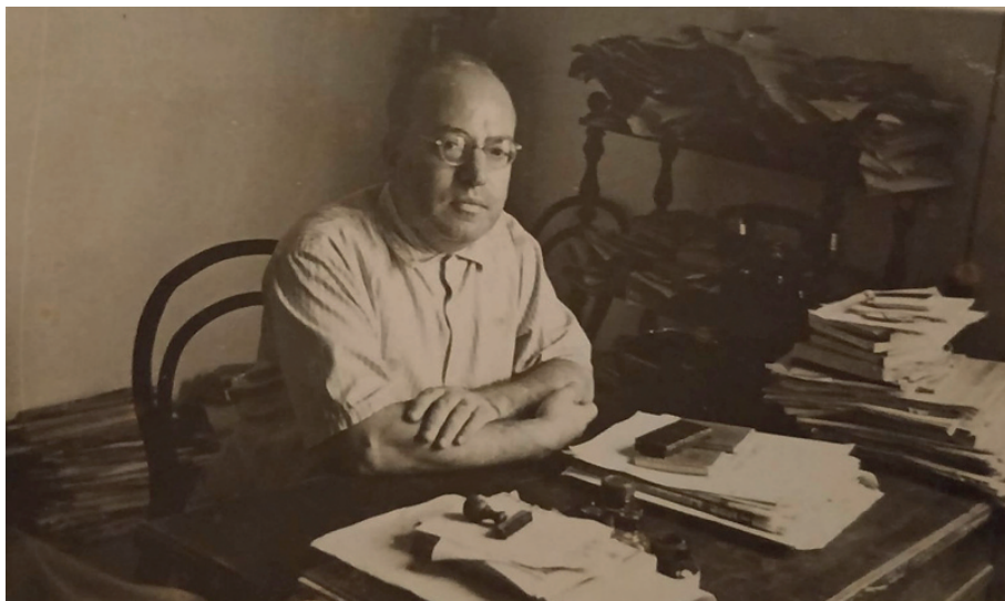
Fig. 1. Pantaleo Ingusci (raccolta privata).

chici, socialisti. «Intellettuale impregnato di salentinità, repubblicano storico, uomo dalla profonda e ineccepibile onestà morale, Pantaleo Ingusci aveva, col suo esempio e con le sue idee, creato la tradizione di una cultura laica nel Salento» (De Matteis, 1986: 12).